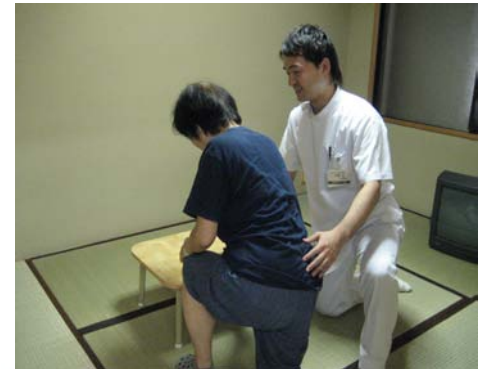
畳からの立ち上がり