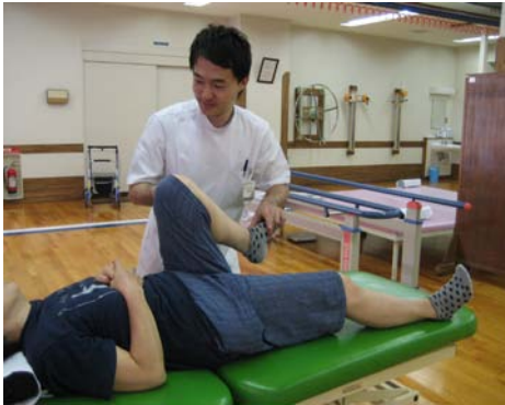
筋力トレーニング